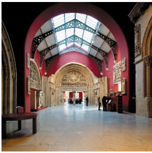
© Cité de l'architecture et du patrimoine